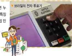
▶ 브라질의 전자 투표기

지속적인 참정권 확대 운동 결과, 20세기 중반에 접어들면서 일정한 연령에 도달하면 누구에게나 참정권이 주어지는 보통 선거 제도가 확립되었다 . 현대 민주 정치의 주요한 특징으로는 보통 선거의 실시, 대의 민주 정치의 실시, 전자 민주주의 등이 있다 . 그러나 간접 민주 정치를 실시하고 있는 여러 나라에서 시민들의 정치적 무관심과 선출된 대표의 부패가 문제로 지적되고 있다 . 이에 선거 기간뿐만 아니라 일상생활에서도 개인 또는 시민 단체의 자발적인 정치 참여를 강조하는 참여 민주주의가 주목받고 있다 .